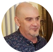
Cesar Millán Comité consultivo de la Fundación Villalar