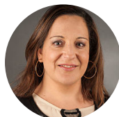
Iratxe García Pérez

Presidenta socialista española en el parlamento europeo