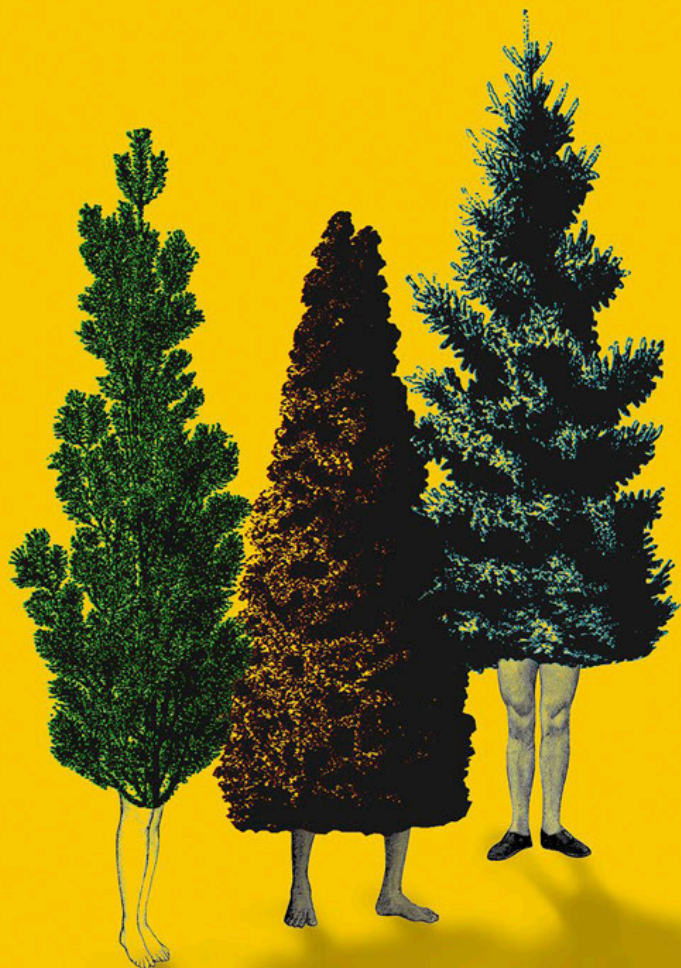
ILUSTRACIÓN LOLA CÓMEZ