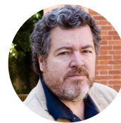
Juantxo López de Uralde

Coportavoz y miembro Ejecutivo Federal de EQUO